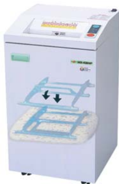
(フロアタイプ) SGX-C3124P 本体価格 ¥448,000