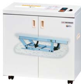
(デスクサイドタイプ) SGX-R3114SP 本体価格 ¥388,000