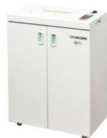
(パーソナルタイプ) SGX-R3112DS 本体価格 ¥198,000