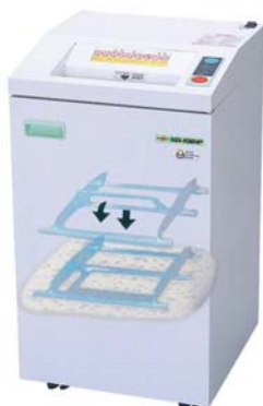
(フロアタイプ) SGX-R3124P 本体価格 ¥438,000